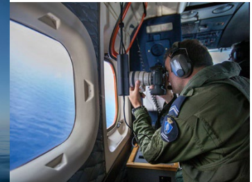
Dutch Frontex Officer