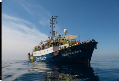
Sea Watch Ship